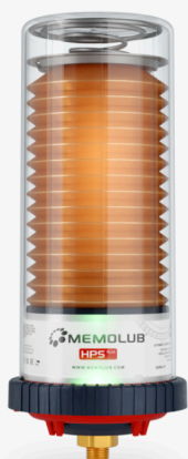
HPS Plus A batteria