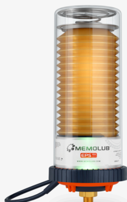
EPS Plus A 24 Volt